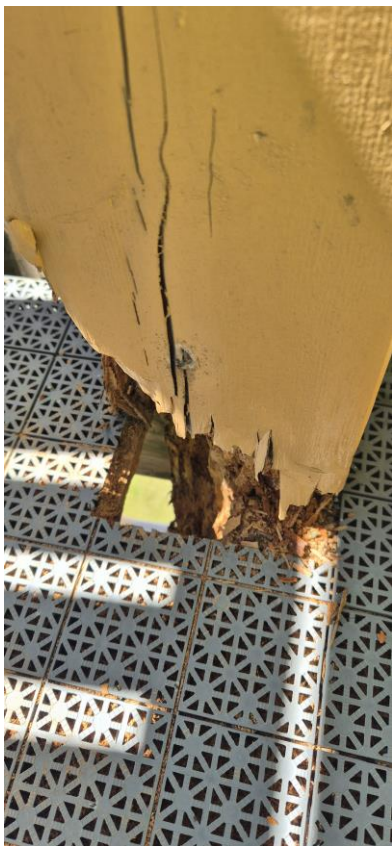
Enkelte steder er treverket råttent helt gjennom og har ikke mye hold igjen.