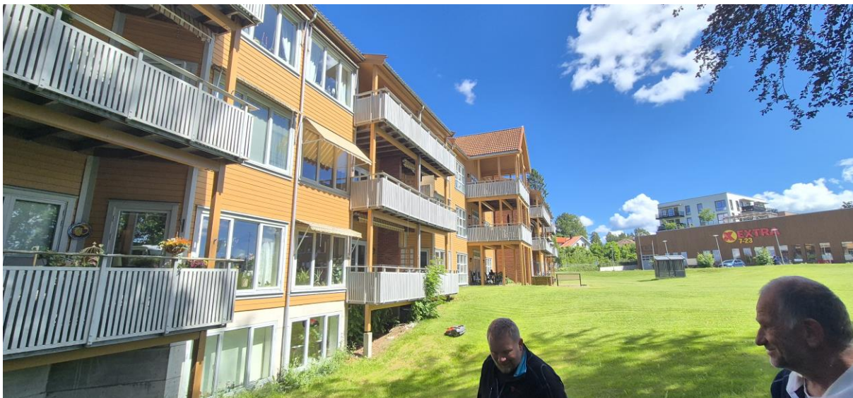
Balkongene som vender mot sør. Alle må byttes.